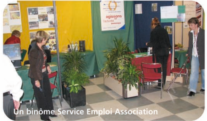
Un binôme Service Emploi Association

Et la foule arrive, chercheurs d'emploi, étudiants en quête de stage ou d'alternance, employés mal employés, jeunes pour un premier job, quinquas pour un dernier, tous plein d'espoir, les CV faits et refaits porteurs de toute une vie, bien rangés dans le porte-documents.