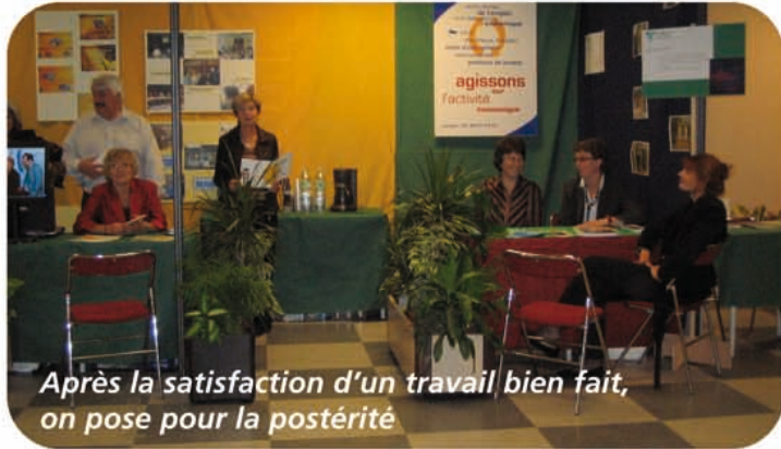
Après la satisfaction d'un travail bien fait, on pose pour la postérité