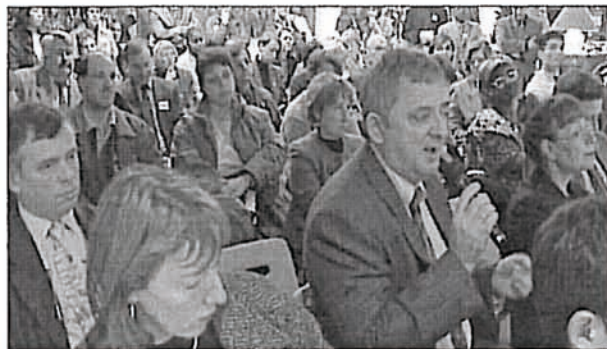
Mobilisation et débats animés à l'espace Lino Ventura