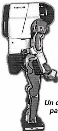
Un candidat parfait ...

« L'aisance relationnelle » : ne pas avoir l'air triste ou fatigué ; avoir une élocution et des postures aussi droites qu'une équerre.